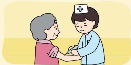
다양한 사회 보장 제도 실시