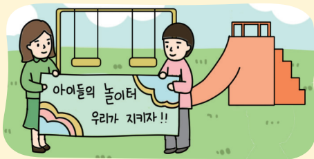
인권 캠페인 활동