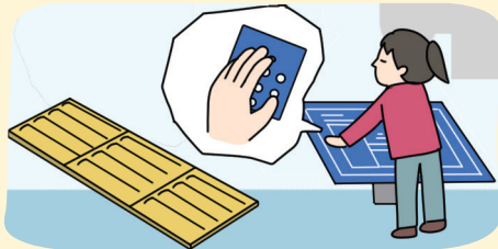
장애인 공공 편의 시설 설치