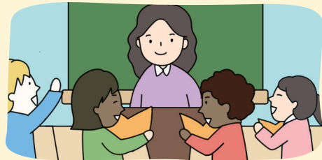
인권 교육 활동