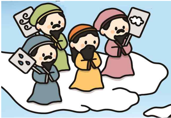
환웅은 풍백, 운사, 우사와 땅으로 내려왔어요.

하늘의 신인 환인의 아들 환웅은 지상 세계에서 살고 싶어 하였어요. 환웅은 농사와 관련된 풍백(바람), 운사(구름), 우사(비)와 함께 땅으로 내려와 지금의 태백산 부근에 터를 잡기 시작했어요. 어느 날, 곰과 호랑이가 사람이 되고 싶다며 찾아왔어요. 환웅은 100일 동안 마늘과 쑥을 먹으면 사람이 될 수 있다고 말했어요. 곰은 100일 동안 참았지만 호랑이는 참지 못하고 중간에 뛰쳐나갔어요. 곰은 여자가 되어 환웅과 결혼해서 아들인 단군왕검을 낳았어요. 단군왕검은 훗날 우리 민족 최초의 나라인 고조선을 세웠어요.