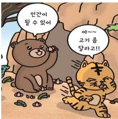
곰은 100일 동안 마늘과 쑥을 먹고 여자가 되었어요.