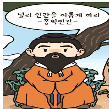
단군왕검은 훗날 우리 민족 최초의 나라인 고조선을 세웠어요.